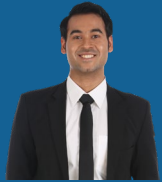
State Court of Justice