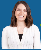
Notary or Registrar